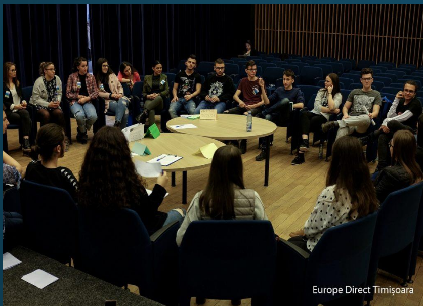
Europe Direct Timișoara