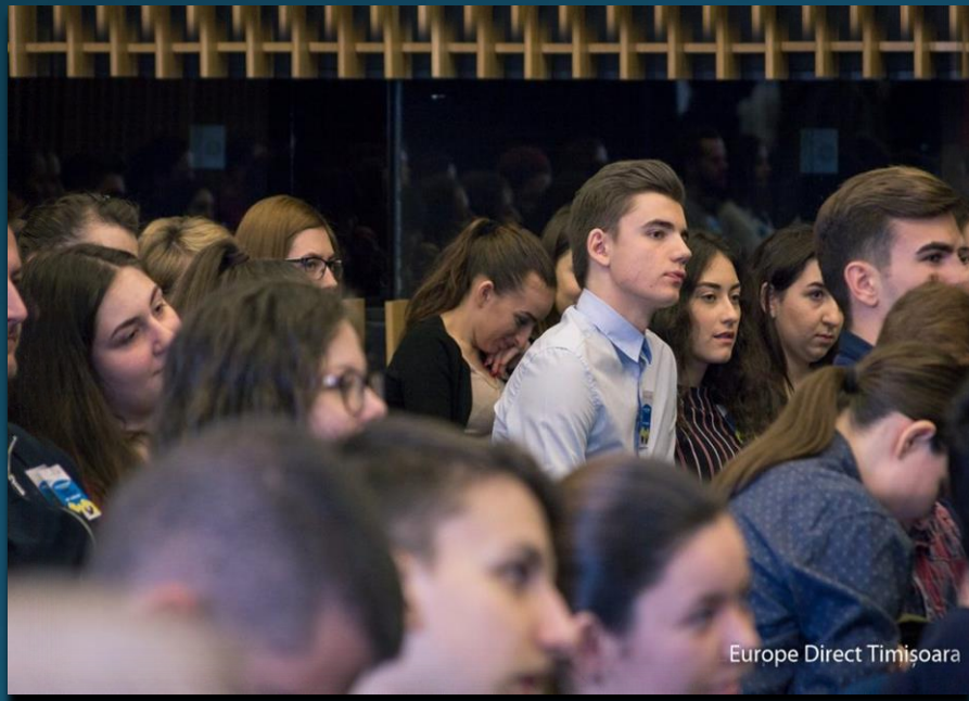
Europe Direct Timisoara