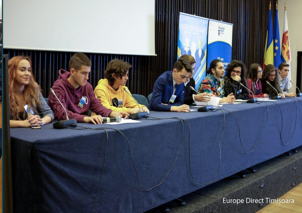
Europe Direct Timișoara