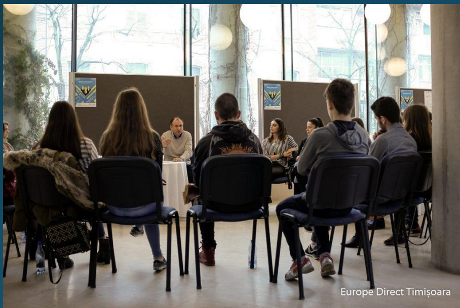
Europe Direct Timișoara